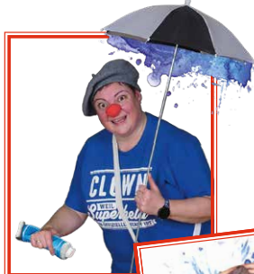
Will Clown Will