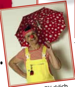
Frau Doktor Glücklich