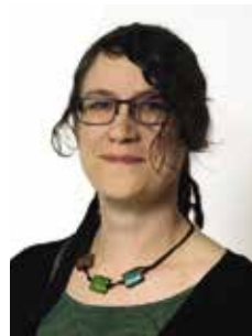
Julia Pliester Graphik-Design